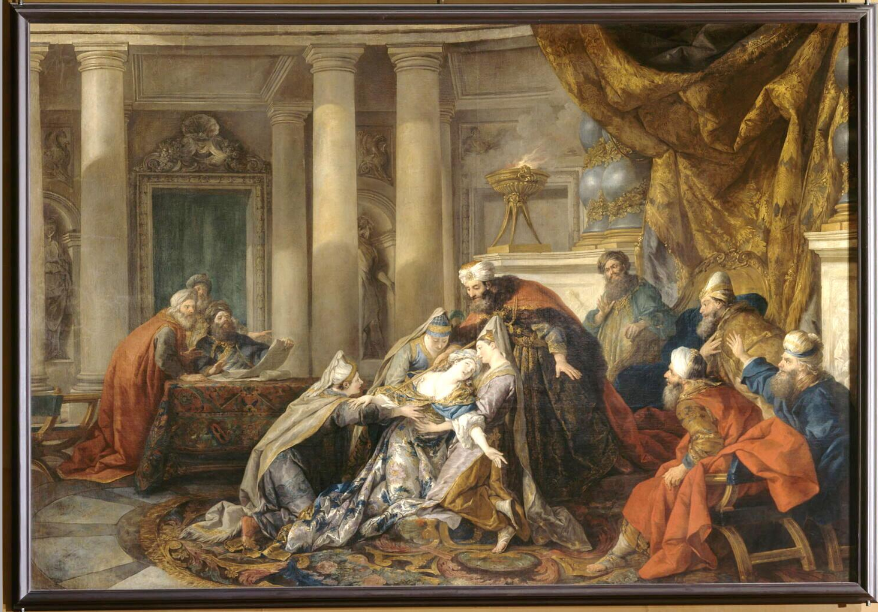
Jean-François de Troy (Paris, 1679 – Rome, 1762), L'Evanouissement d'Esther , 1737, peinture à l'huile sur toile, Paris, musée du Louvre.