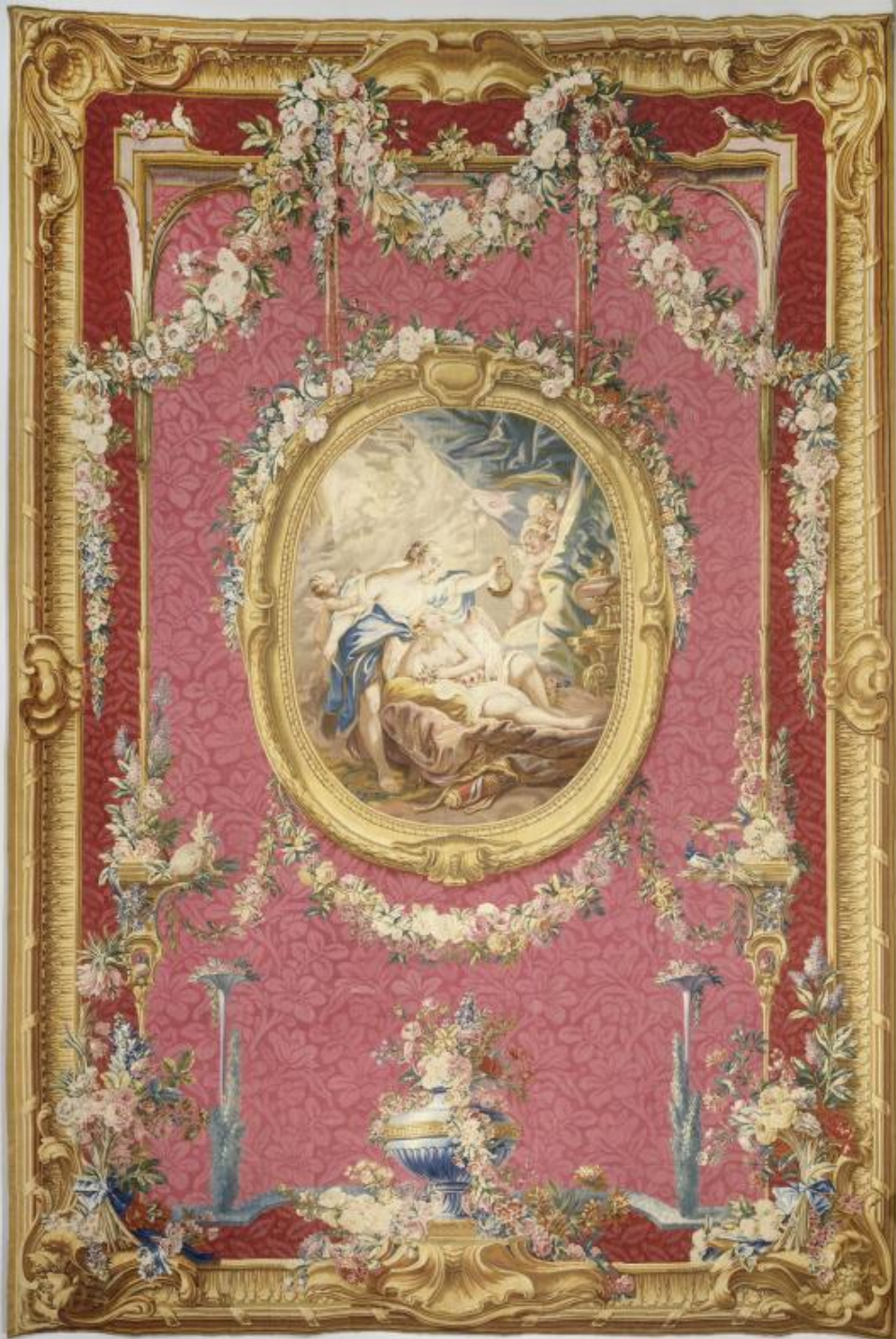
France (Paris, Les Gobelins), XVIIIe siècle, Tenture des Amours des Dieux : Amour et Psyché, d'après Boucher, vers 1775, laine, Paris, musée du Louvre.