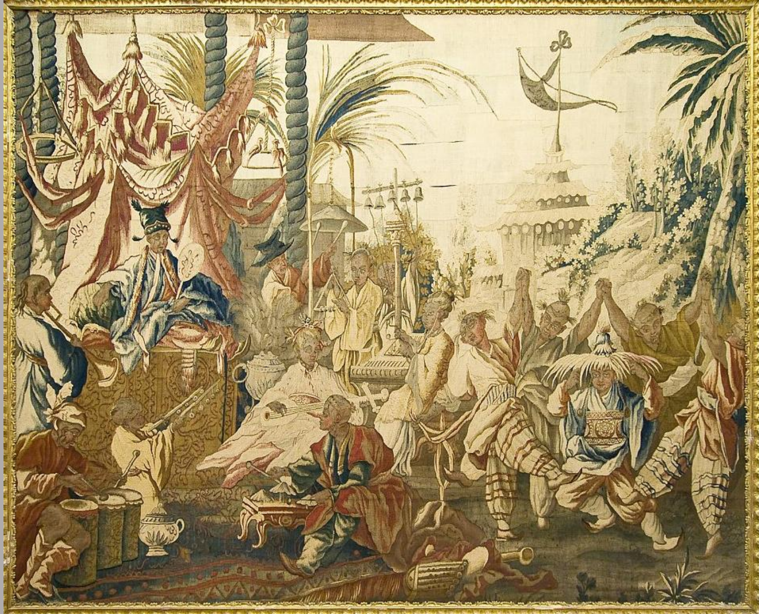
France (Aubusson), XVIIIe siècle, La Danse chinoise, d'après Boucher , vers 1755/70, laine et soie, Paris, musée Nissim de Camondo.