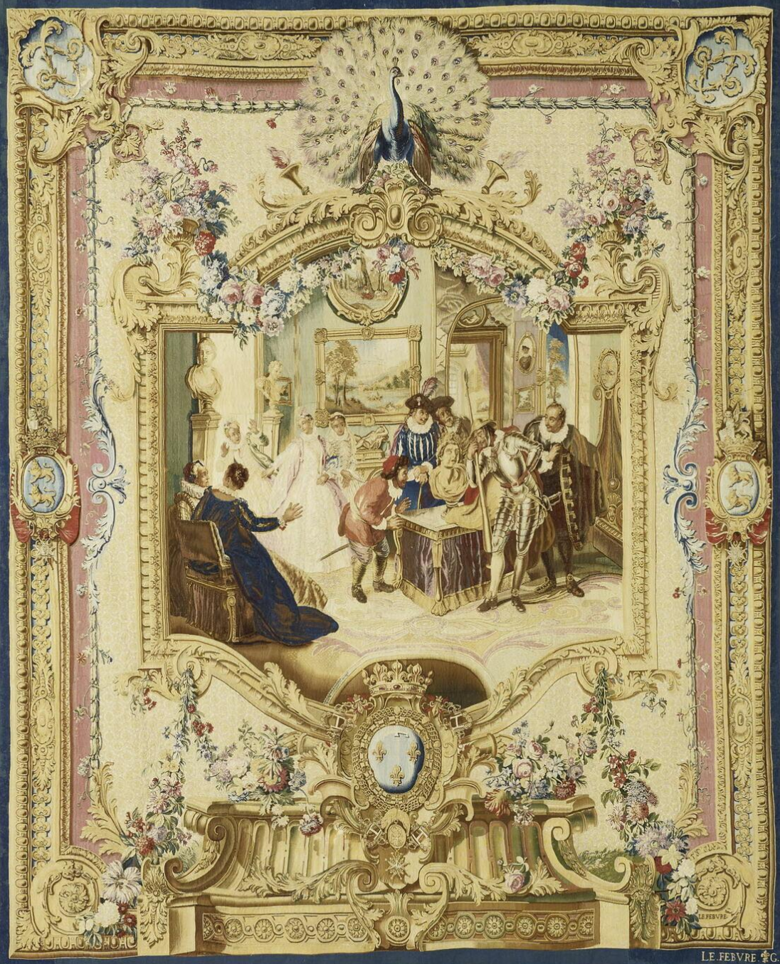
France (Paris, Les Gobelins), XVIIIe siècle, Tenture de l'Histoire de don Quichotte : La Tête enchantée, d'après Coypel, 1732/6, laine, Paris, musée du Louvre.