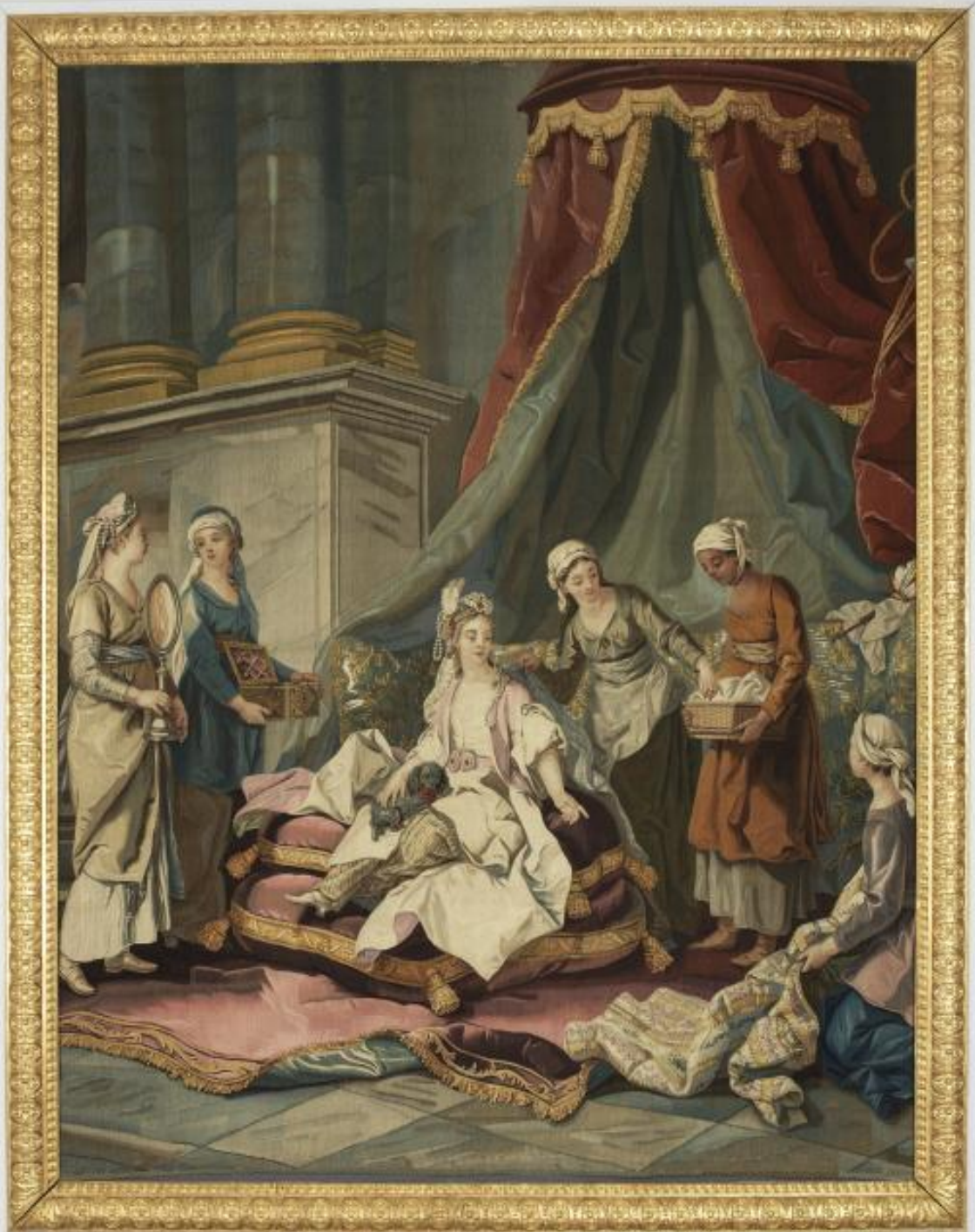
France (Paris, Les Gobelins), XVIII siècle, Tenture des Costumes turcs : La Toilette de la Sultane, d'après Van Loo, vers 1774, laine, Compiègne, Château.