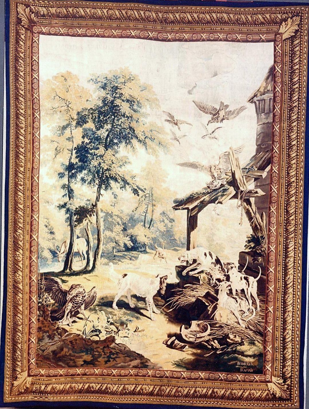
France (Beauvais), XVIII e siècle, Tenture des Fables de la Fontaine : La Lice et sa compagne, d'après Oudry, vers 1740, laine et soie, Paris, Mobilier National.