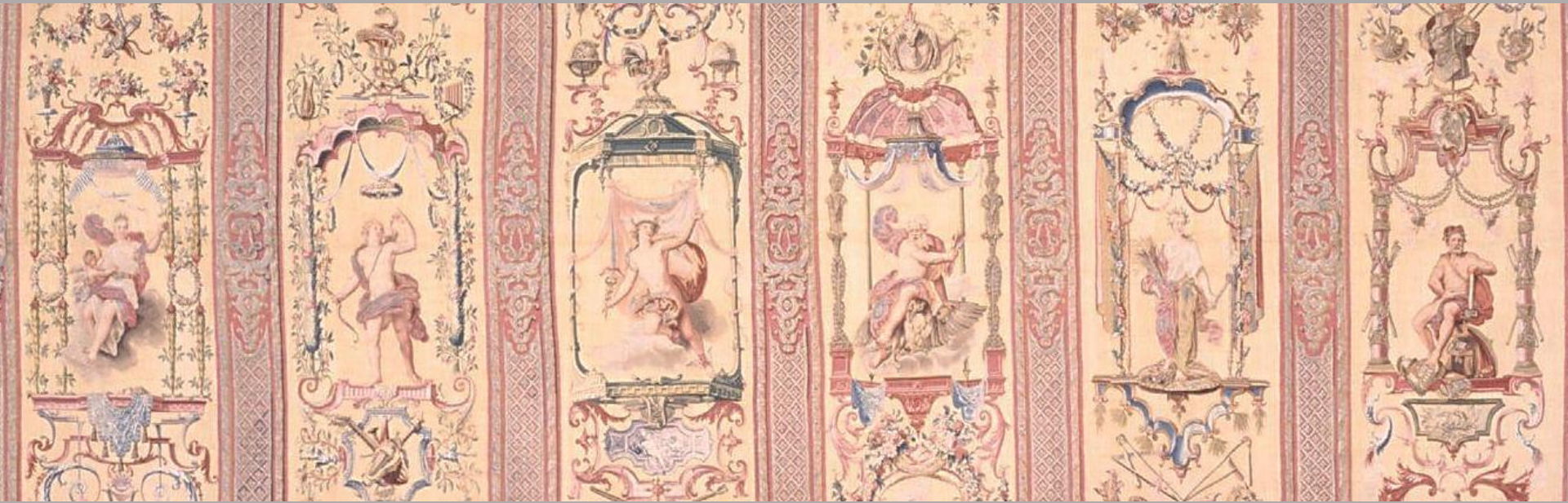
France (Paris, Les Gobelins), XVIII e siècle, Tenture des Mois grotesques (détail) : Avril (Vénus), Mai (Apollon), Juin (Mercure), Juillet (Jupiter), Août (Cérès) et Septembre (Vulcain), d'après Audran, 1710, laine et argent, Paris, Mobilier National.