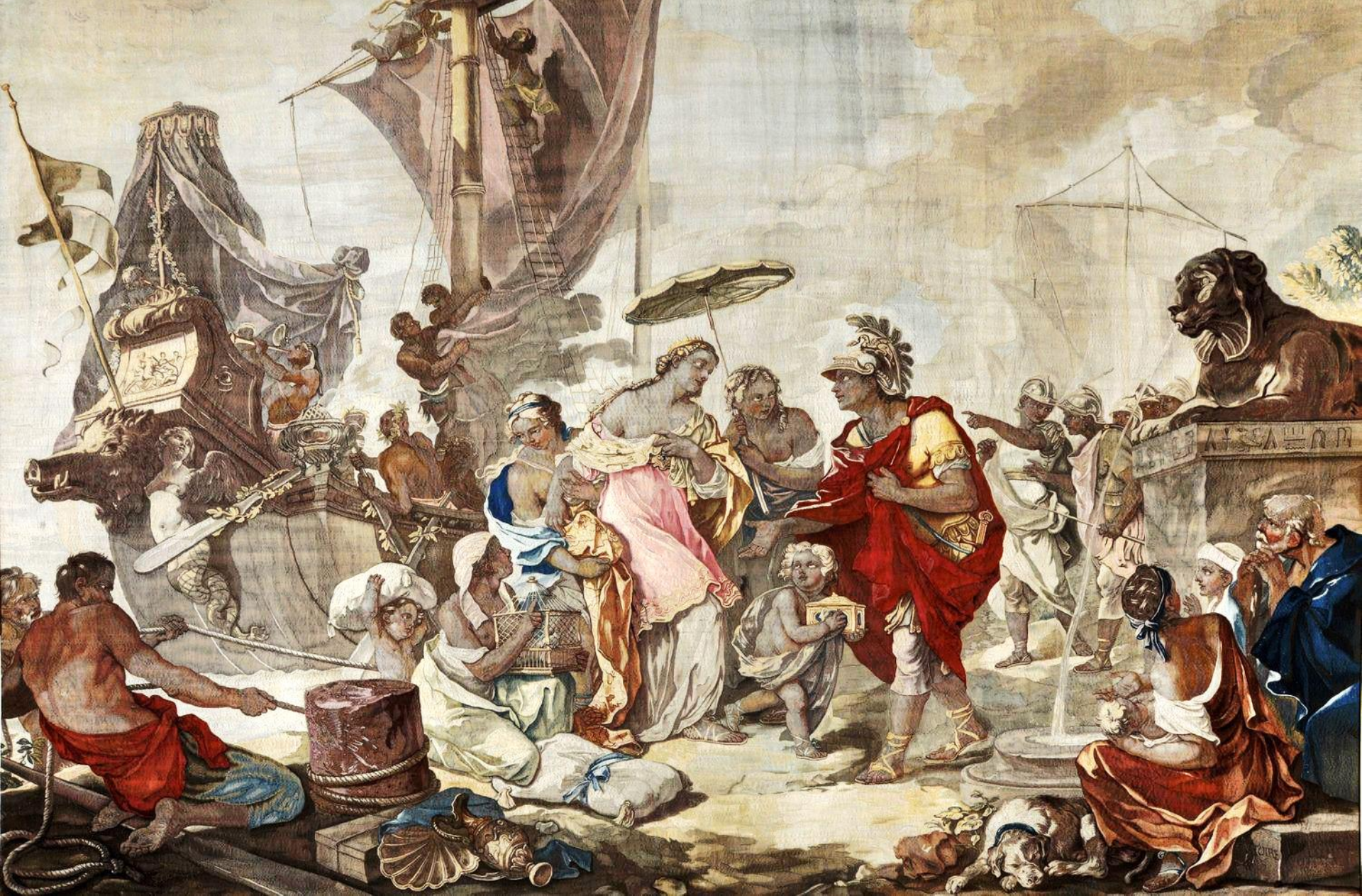
France (Paris, Les Gobelins), XVIIIe siècle, Tenture de l'Histoire de Marc Antoine : L'Arrivée de Cléopâtre à Tarse, d'après Natoire, 1761/3 , laine, Paris, Mobilier National.