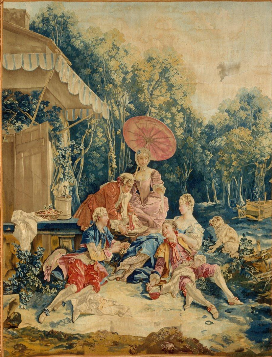
France (Beauvais), XVIIIe siècle, Tenture des Fêtes italiennes : La Collation, d'après Boucher, vers 1736/8, laine, New York, The Metropolitan Museum of Art.