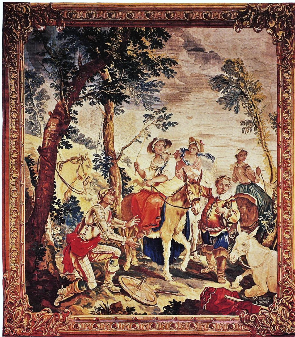
France (Beauvais), XVIIIe siècle, Tenture de Don Quichotte : La Fausse Dulcinée, d'après Natoire, vers 1735/44, laine, Aix-en-Provence, musée des Tapisseries.