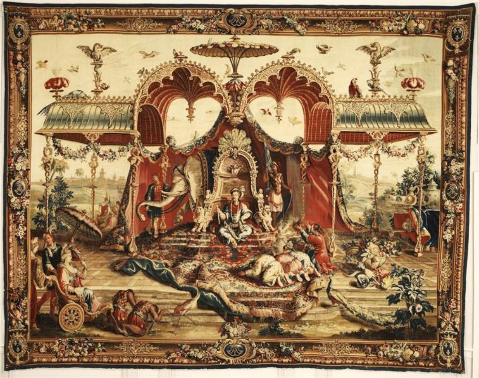
France (Beauvais), XVIIe/XVIIIe siècle, Histoire de l'empereur de Chine : L'Audience du prince, d'après Fontenay, Monnoyer et Vernansal , vers 1690/1730, laine, Paris, musée du Louvre.