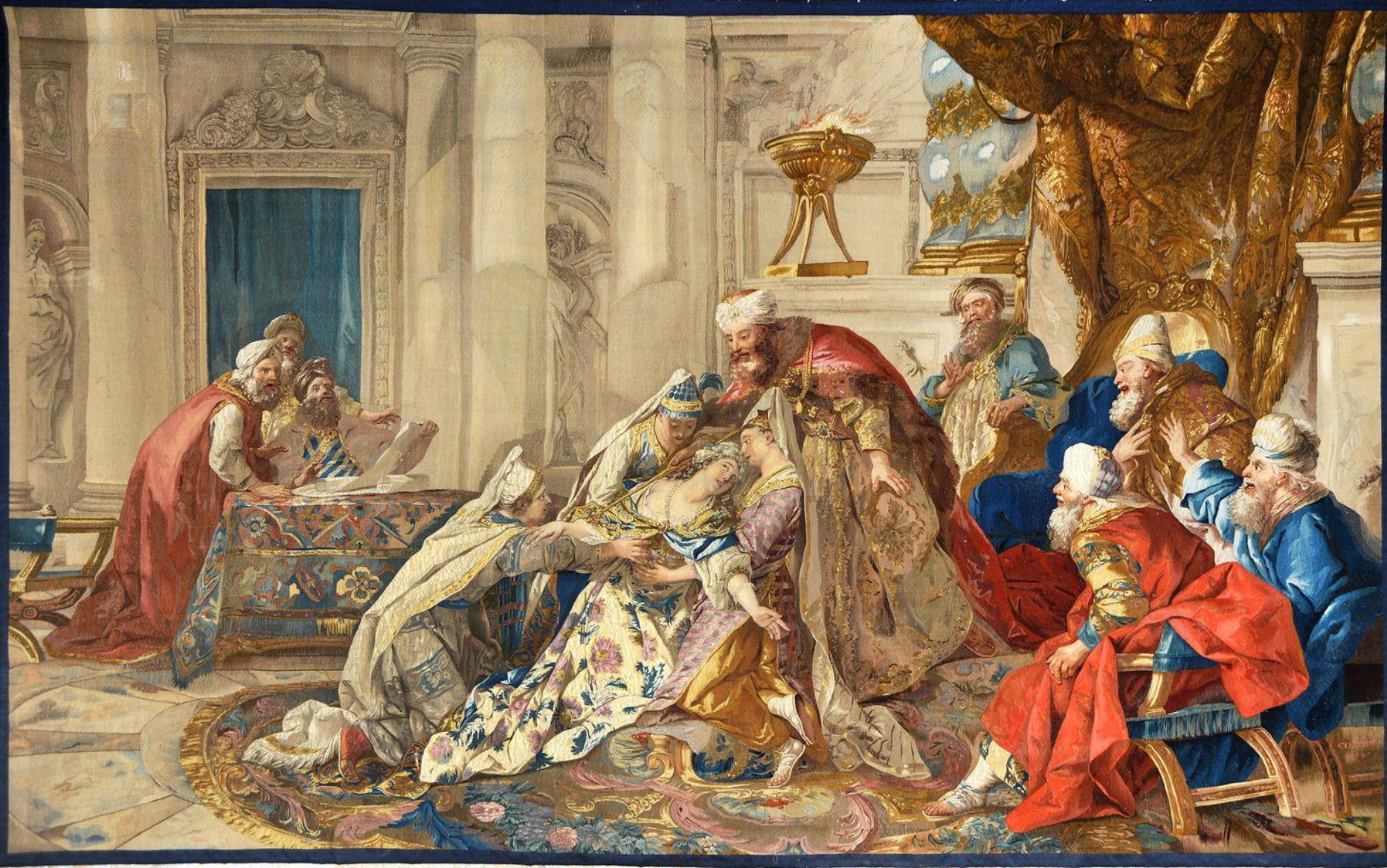
France (Paris, Les Gobelins), XVIIIe siècle, Tenture de l'Histoire d'Esther : L'Evanouissement d'Esther, d'après de Troy, 1771/4 , laine, Paris, Mobilier National.