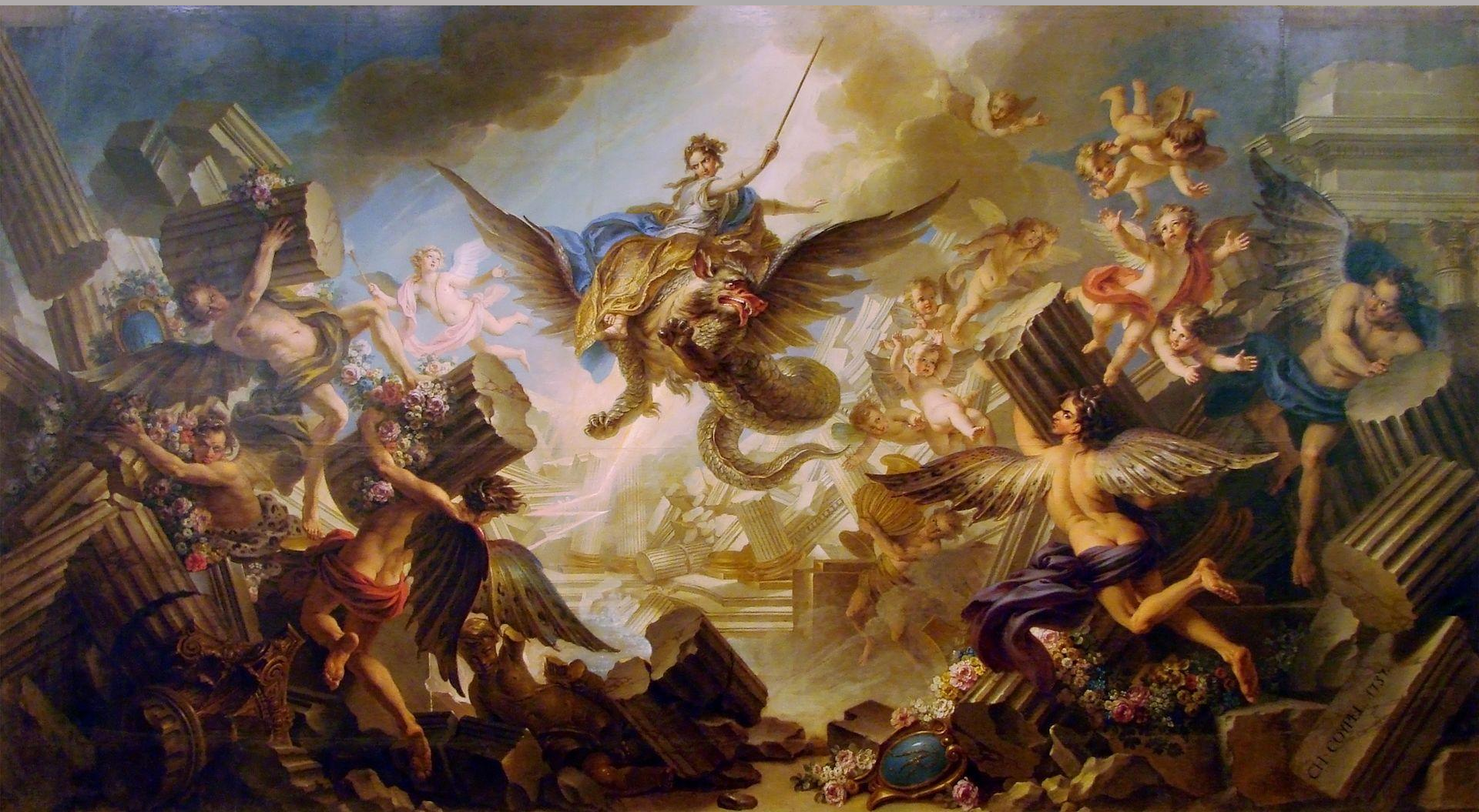
Charles-Antoine Coyppel (Paris, 1694 – Paris, 1752), La Destruction du palais d'Armide , 1737, peinture à l'huile sur toile, Nancy, musée des Beaux-Arts.