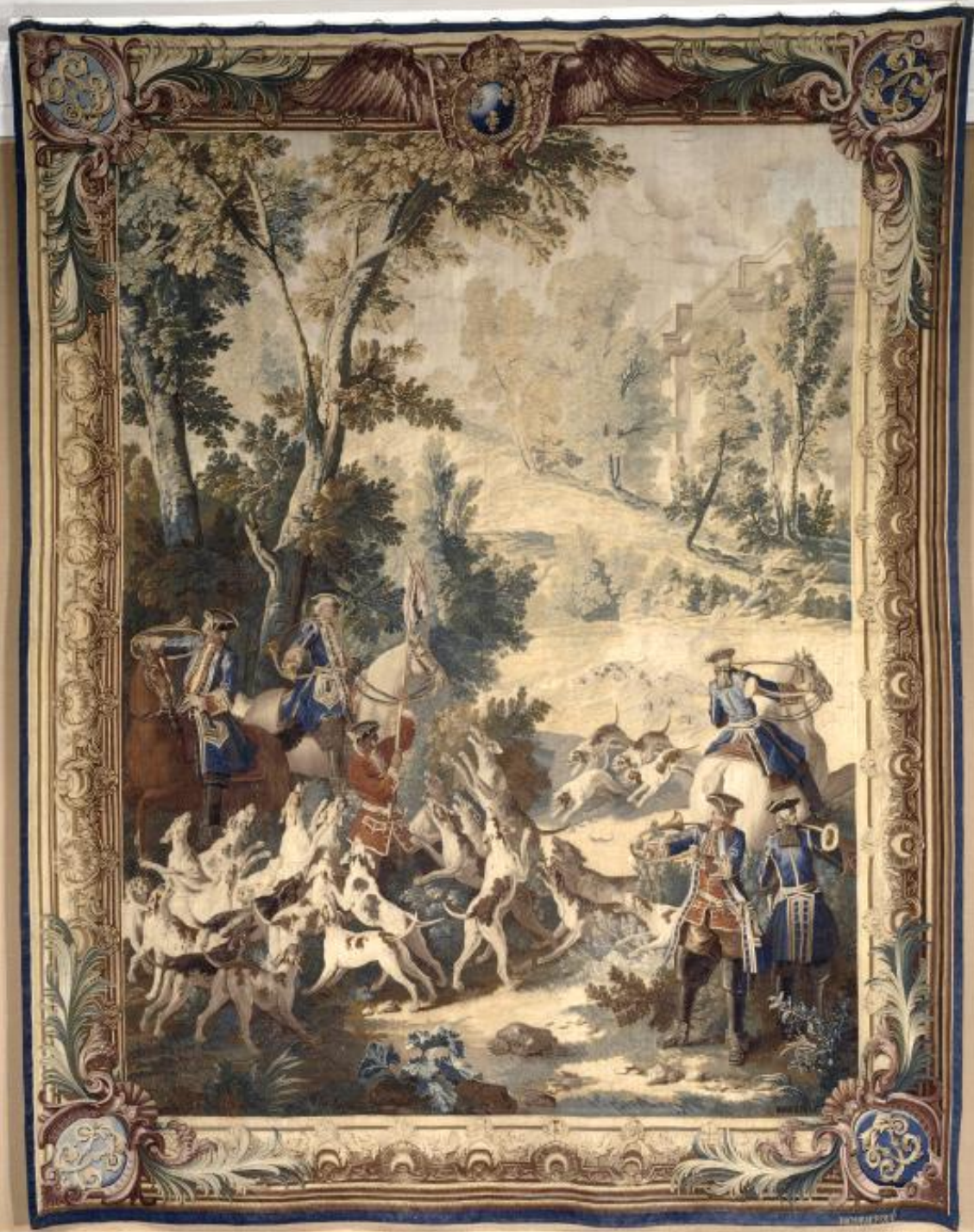
France (Paris, Les Gobelins), XVIIIe siècle, Tenture des Chasses de Louis XV : La Petite curée, d'après Oudry, vers 1740, laine, Compiègne, Château.