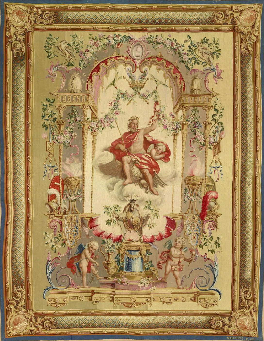
France (Paris, Les Gobelins), XVIII e siècle, Tenture des Portières des Dieux : Jupiter ou le Feu, d'après Audran, 1764, laine, Paris, musée du Louvre.