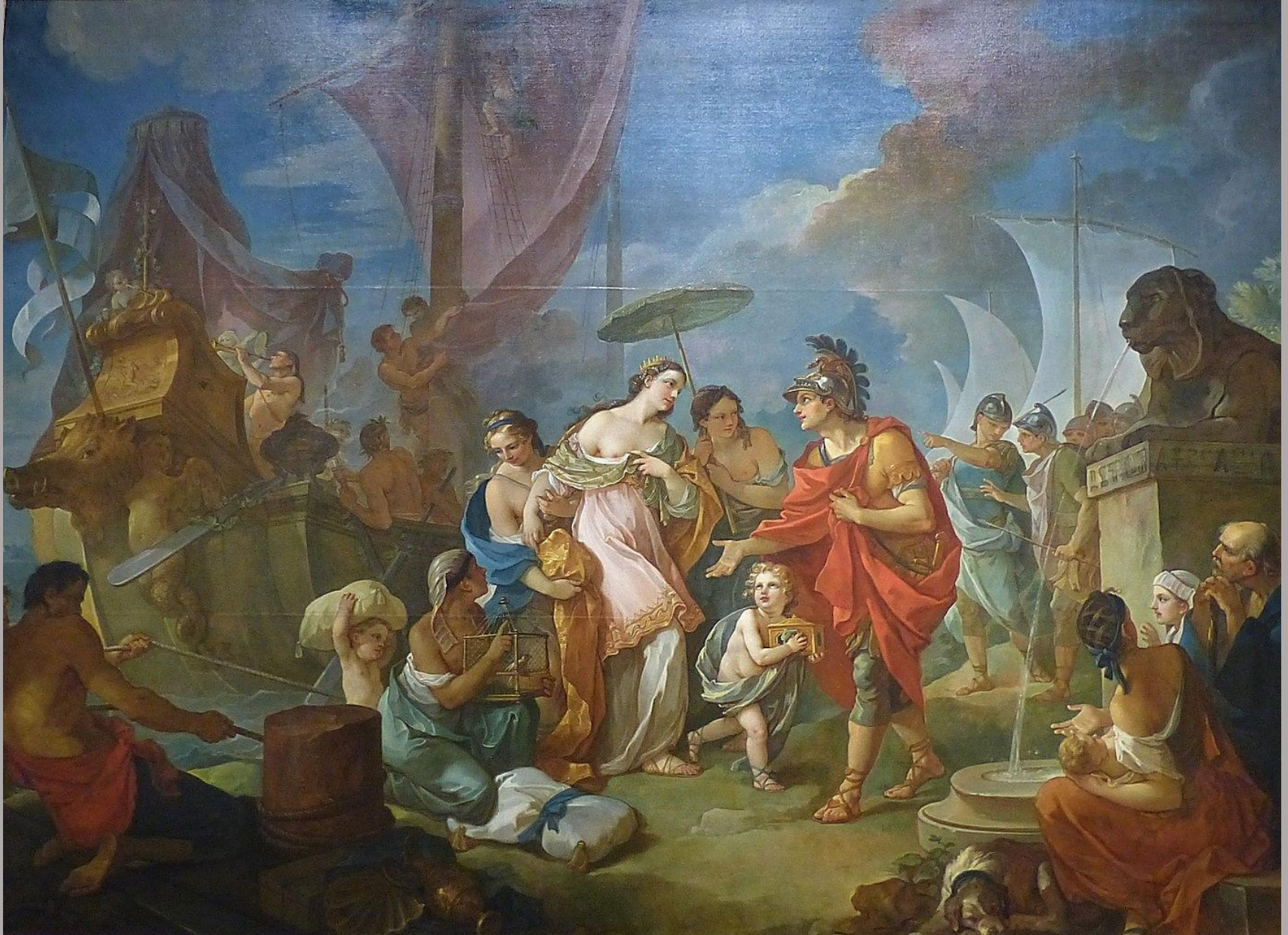
Charles-Joseph Natoire (Nîmes, 1700 – Castel Gandolfo, 1777), L'Arrivée de Cléopâtre à Tarse , 1756, peinture à l'huile sur toile, Nîmes, musée des Beaux-Arts.