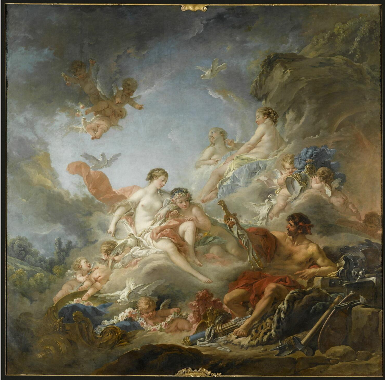
François Boucher (Paris, 1703 – Paris, 1770), Vénus et Vulcain , 1757, peinture à l'huile sur toile, Paris, musée du Louvre.