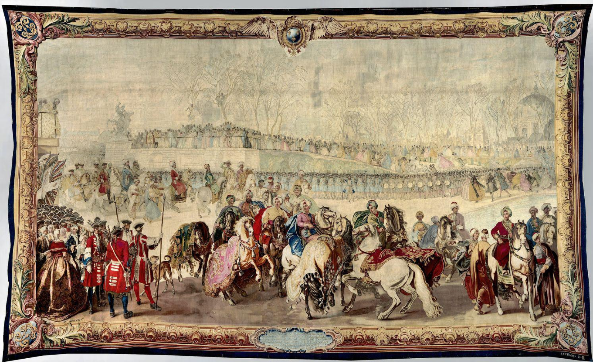
France (Paris, Les Gobelins), XVIII e siècle, Tenture de l'Ambassade Turque : L'Entrée des Tuileries, d'après Parrocel, vers 1730 , laine, Paris, Mobilier National.