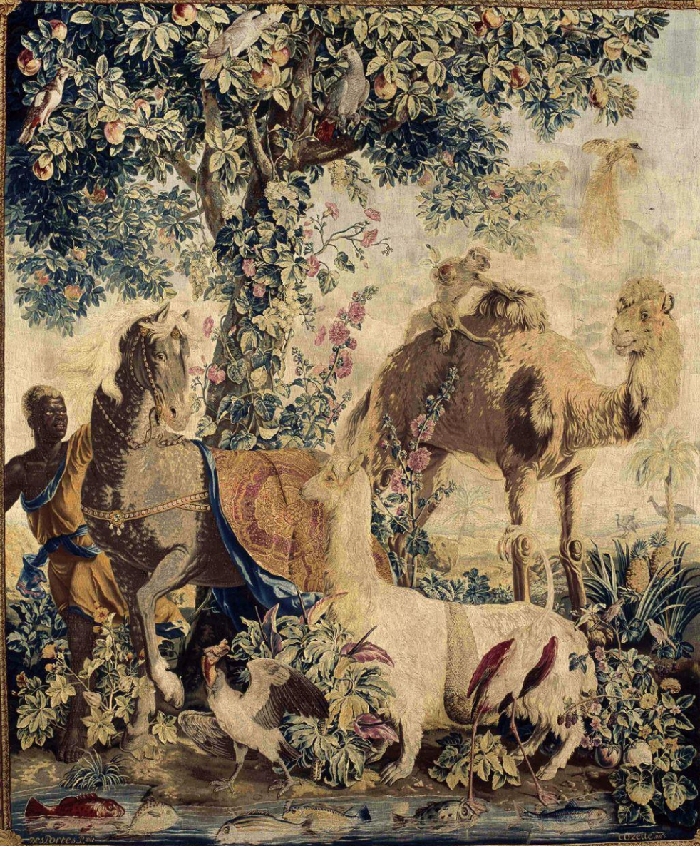
France (Paris, Les Gobelins), XVIII e siècle, Tenture des Nouvelles Indes : Le Chameau, d'après Desportes, vers 1740/1, laine, Paris, Mobilier National.