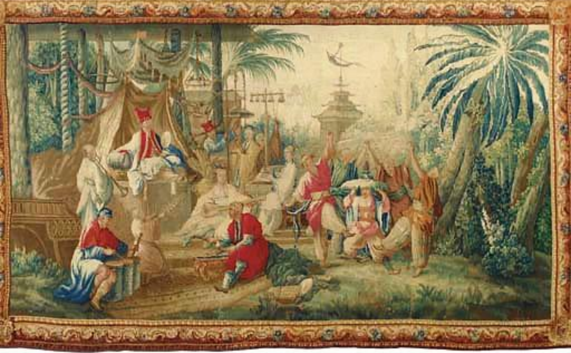
France (Aubusson), XVIIIe siècle, La Danse chinoise, d'après Boucher , vers 1755/70, laine et soie, collection particulière.