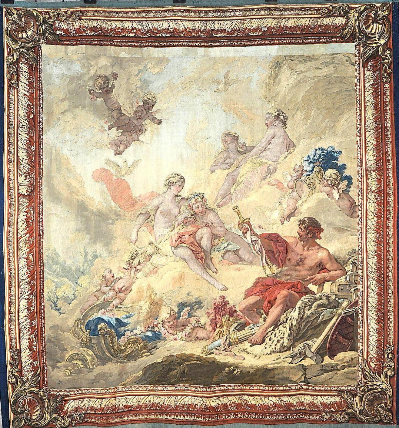
France (Paris, Les Gobelins), XVIII e siècle, Tenture des Amours des Dieux : Vénus et Vulcain, d'après Boucher, 1758/9, laine, Paris, Mobilier National.