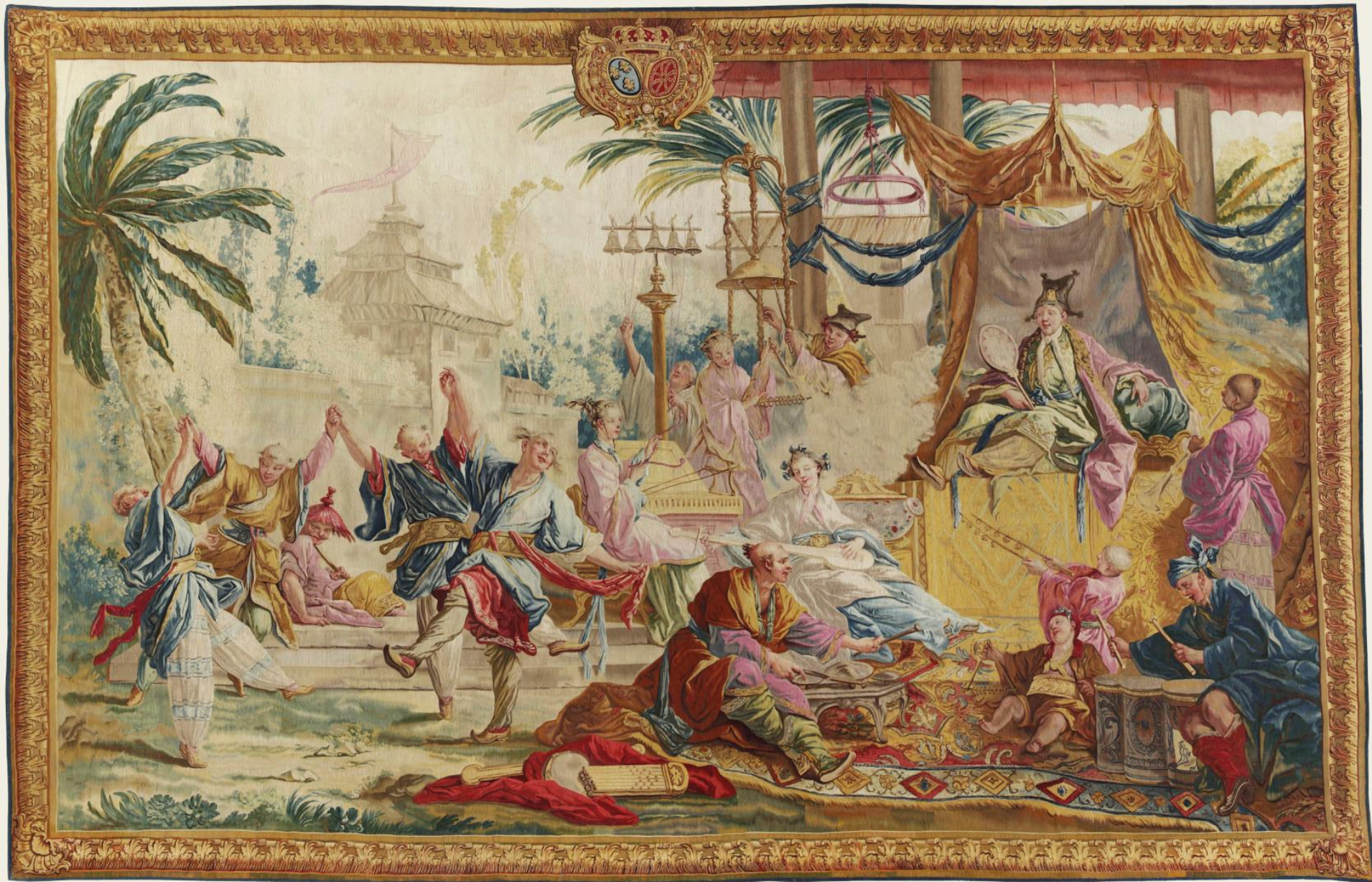
France (Beauvais), XVIIIe siècle, Tenture Chinoise : La Danse chinoise, d'après Boucher , vers 1758/60, laine, collection particulière.