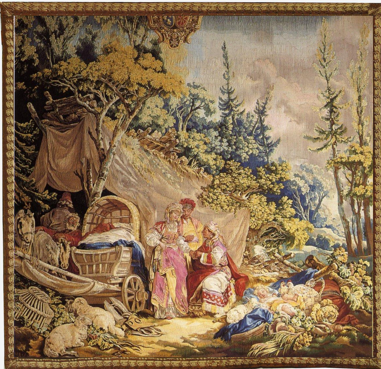
France (Beauvais), XVIIIe siècle, Tenture des Jeux russiens : La Diseuse de Bonne aventure, d'après Le Prince, vers 1750/80, laine, Paris, musée du Louvre.