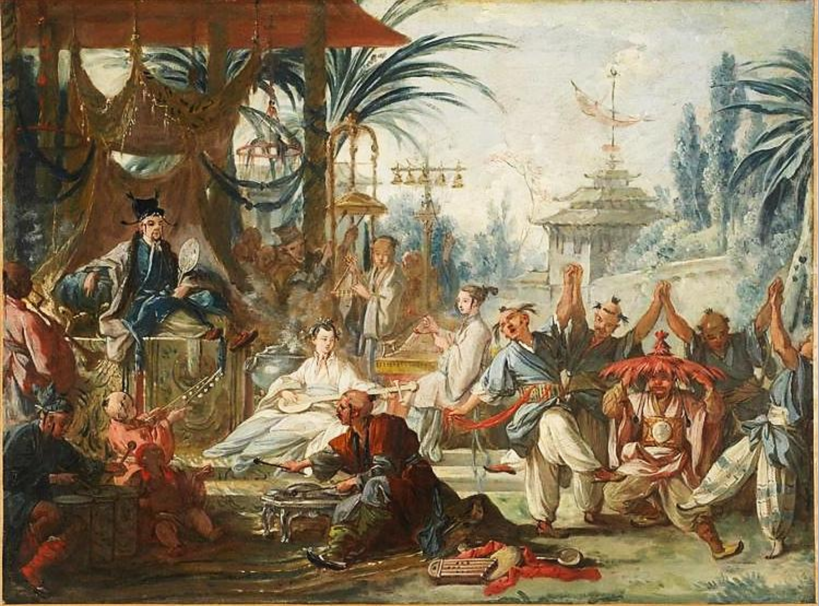
François Boucher (Paris, 1703 – Paris, 1770), La Danse chinoise , vers 1742, peinture à l'huile sur toile, Besançon, musée des Beaux-Arts et d'Archéologie.