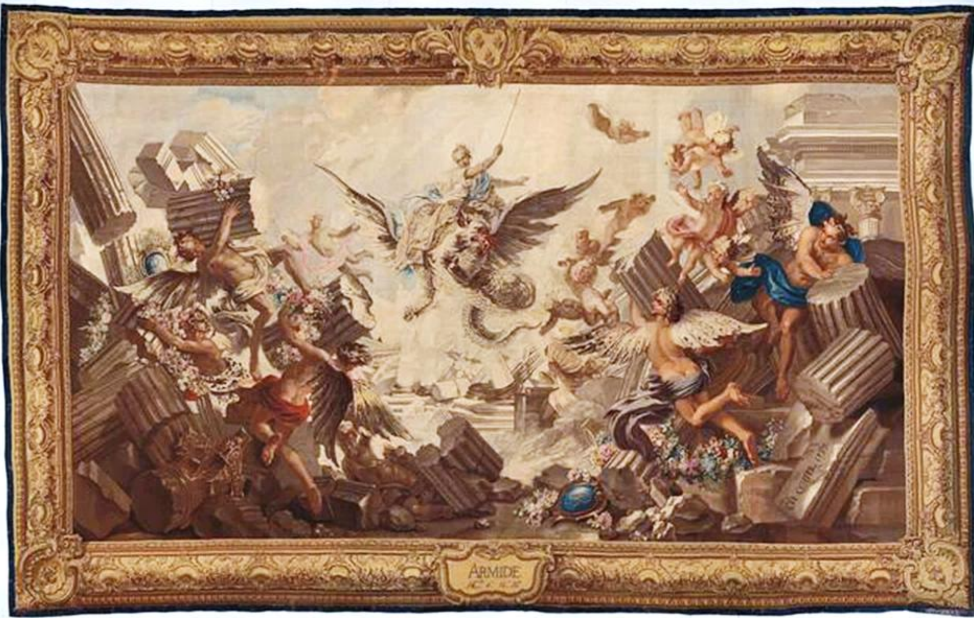
France (Paris, Les Gobelins), XVIIIe siècle, Tenture des Fragments d'opéras : La Destruction du palais d'Armide, d'après Coypel, 1732/6 , laine, Paris, Mobilier National.